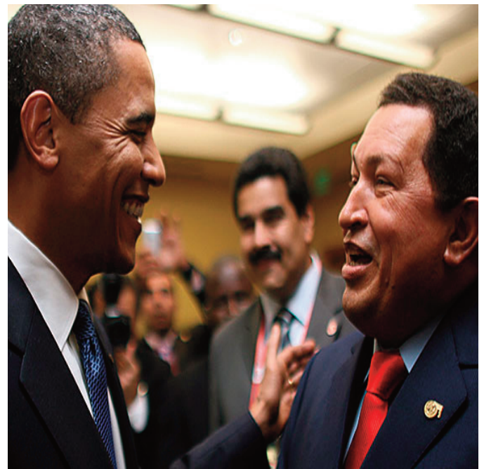
BARAK OBAMA SALUDA A HUGO CHÁVEZ EN LA V CUMBRE.

Podría decirse que la Cumbre celebrada en el Caribe significó nada más y nada menos que un acercamiento formal entre los EE.UU. y todos sus opositores de la región. Las declaraciones del presidente de EE.UU. sobre el fin del período en que Washington se limitaba al uso de su poder militar, de que ningún país de la región representa una amenaza para los intereses estadounidenses y la intención de entablar un diálogo entre iguales, lleva a que algunos analistas sostengan que a partir del encuentro en Trinidad, lo que se produjo es un importante cambio en las relaciones EE.UU.-América Latina y el Caribe, representada por el fin de la "doctrina Monroe" y su remplazo por "la doctrina Obama", basada en una política más conciliatoria y dialoguista. □