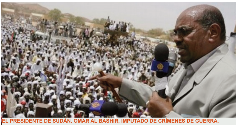
EL PRESIDENTE DE SUDÁN, OMAR AL BASHIR, IMPUTADO DE CRÍMENES DE GUERRA.

Por su parte, el ex presidente de Sudáfrica, Thabo Mbeki, ha sido designado por la Unión Africana para formar un comité de investigación con respecto a las violaciones de Derechos Humanos cometidas en Darfour, y de esta forma erigirse en mediador entre la Haya y el gobierno de Sudán. El gobierno de Sudáfrica apoya el otorgamiento de un período de un año para que puedan realizarse investigaciones en relación a los crímenes. □