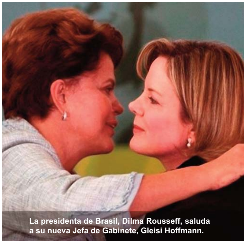
La presidenta de Brasil, Dilma Rousseff, saluda a su nueva Jefa de Gabinete, Gleisi Hoffmann.

manifestación de ello es el creciente apoyo popular logrado por la presidenta, el cual según una encuesta de Datafolha creció del 47 al 49% con respecto al mes de marzo. No obstante, y pese a estar manejando airoso el conflicto, el gobierno tiene frente así el desafío generar un diálogo y acercamiento creciente entre los 10 partidos que conforman la coalición gobernante para superar la insatisfacción de los sectores parlamentarios por la falta de diálogo con el gobierno. En este sentido, otra encuesta publicada por el diario Folha de San Pablo, encontró que 55 de los 95 legisladores consultados destacaron que su relación con la presidencia era mejor durante el gobierno de Lula da Silva y que notan un cierto tinte autoritario en el Ejecutivo dado que no son recibidos en las audiencias. Revertir esta situación y consideraciones adversas en el seno del Parlamento, junto con el combate de la corrupción en los altos sectores gubernamentales, es una de las principales tareas de Dilma de cara a los próximos meses de gestión.