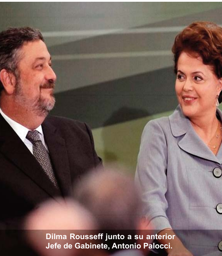
Dilma Rousseff junto a su anterior Jefe de Gabinete, Antonio Palocci.