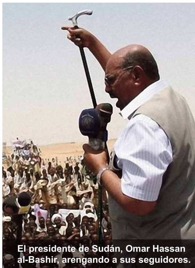
El presidente de Sudán, Omar Hassan al-Bashir, arengando a sus seguidores.

parte, que en un principio apoyó diplomática y militarmente a Jartum, ha ido modificando progresivamente su posición ante la inminente secesión. Aunque trata de mantenerse fiel a su política de no injerencia en los asuntos internos de los estados, ya comenzó a jugar sus piezas económicas en Sudán del Sur. Si bien, la presión internacional logró el establecimiento de un acuerdo en los últimos días, esto dista de ser un compromiso permanente, principalmente de cara a lo que pueda suceder en los días próximos a la independencia de Sudán del Sur. Es importante tenerlo en cuenta en tanto, no solo porque ninguna de las dos partes en el conflicto están dispuestas a ceder ante el otro, sino también porque nace allí una nueva frontera entre el África negra y el África Árabe, determinante para el tablero del conflicto étnico y religioso del continente.