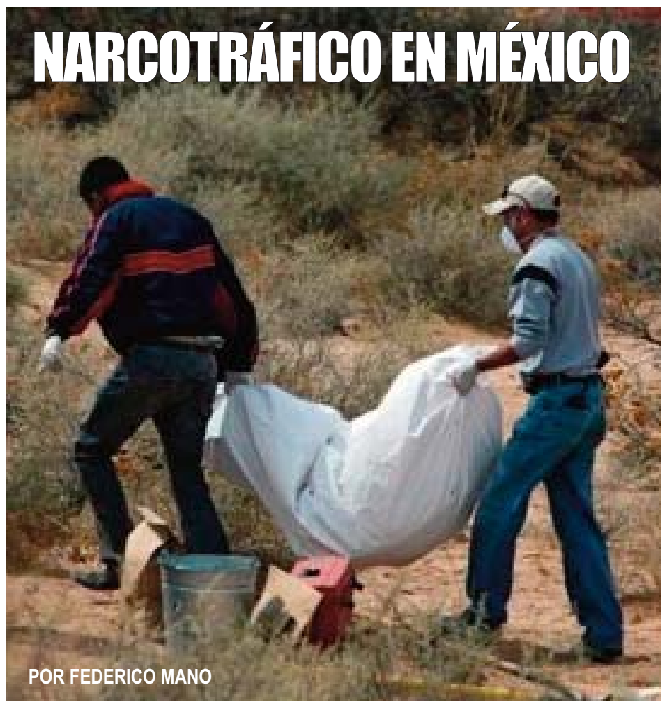
POR FEDERICO MANO

No caben dudas que México es actualmente el país número uno en el tráfico de drogas, entiéndase elaboración y distribución de sustancias ilegales, pero es sólo una parte del eslabón. La droga generada es ingresada ilegalmente a través de camiones, autos, personas, barcos, aviones a Estados Unidos (mayor consumidor de estas sustancias) y África y luego introducida en Europa para su posterior comercialización. Comenta el periodista y escritor italiano Roberto Saviano, autor del libro Gomorra, "el gobierno mexicano actuó demasiado tarde y, ni siquiera con la ayuda de Estados Unidos, podrá resolver este desafío si no se convierte en una prioridad internacional al nivel del terrorismo"